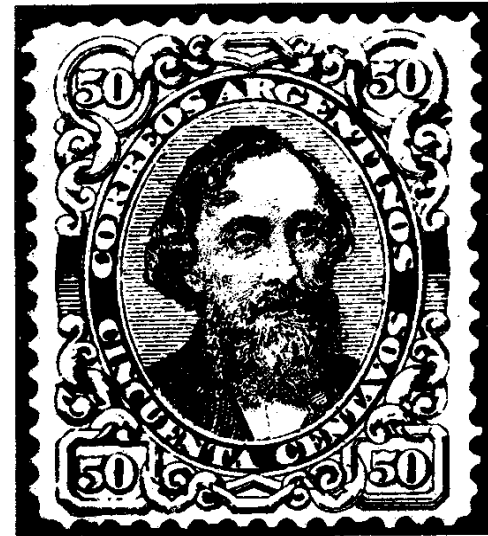
Reconstrucción de la Plancha